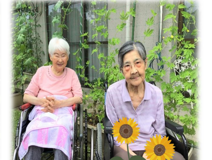
園芸クラブのご様子♪