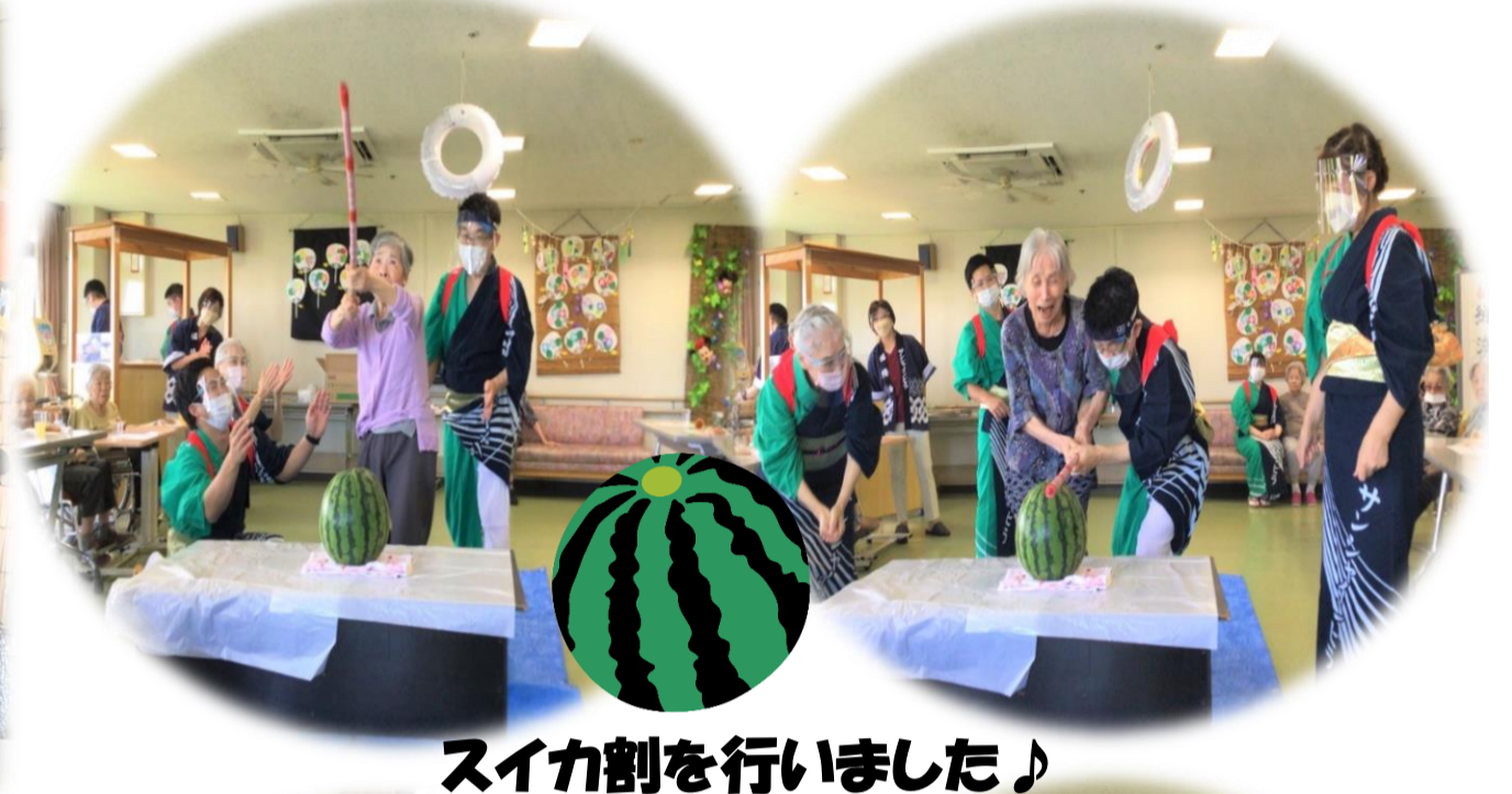
スイカ割を行いました♪