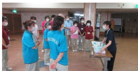
外部講師を招いて研修会

社会福祉法人 福 陽 会 特別養護老人ホーム 第2 サンシャインビル 〒197-0011 東京都福生市福生 3244-10 TEL 042-553-3701 FAX 042-553-3715 http://www.fukuyokai.or.jp