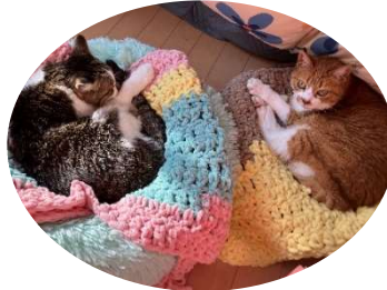
かりん・ちやとら