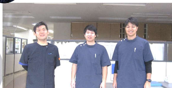
リハビリスタッフ