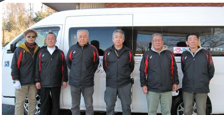
介助員（ドライバースタッフ）