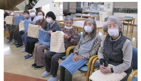
ひざ掛けのプレゼント (あったか〜い)