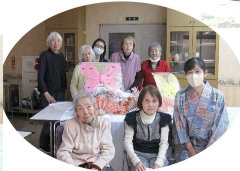
お抹茶 大変おいしゅう ございました