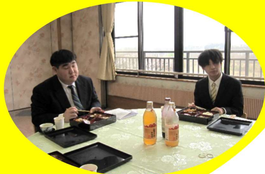
福陽会に新卒者2名の方が入社されました