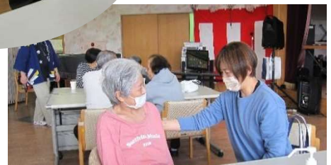
ご家族様と楽しい一時を 過ごされました